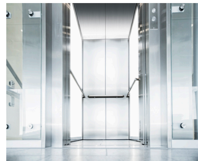
Glasaufzüge der Lift AG sind architektonisch besonders attraktiv.

Die Lift AG ist auch in Bezug auf die Umwelt innovativ. Gerade in der heutigen Zeit sind modernste Technik und Energieeffizienz in aller Munde. Dank der jahrelangen Erfahrung im Liftbau produziert die Lift AG heute stromsparende Aufzüge, die in allen Klassen die höchste Energieeffizienz erfüllen.