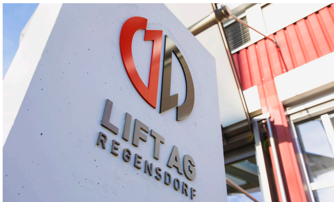
Hauptsitz und Produktionsstätte der Lift AG in Regensdorf.